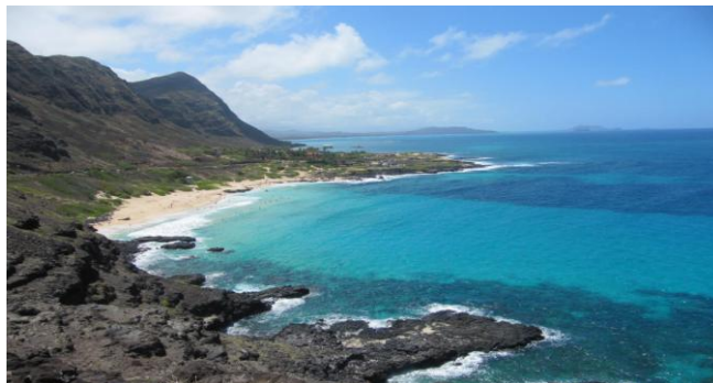
≪イメージ写真オアフ島≫